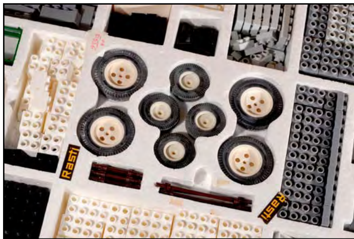
Rasti, juego de encastre