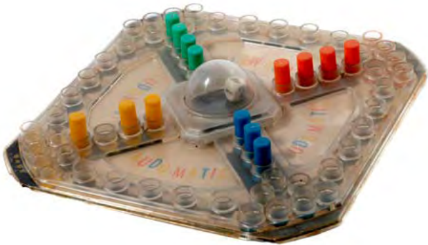
Juego de Ludomatic