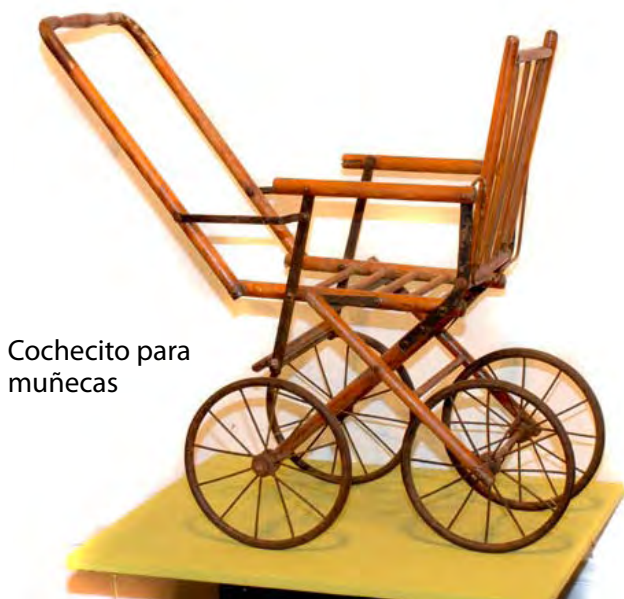
Cochecito para muñecas