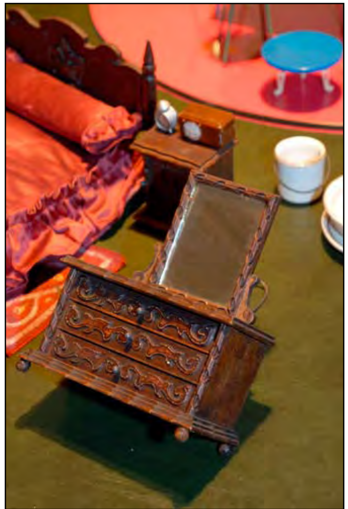
Muebles para muñecas