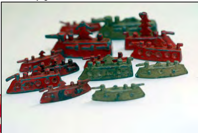
Barcos de juguete