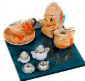
Juego de té