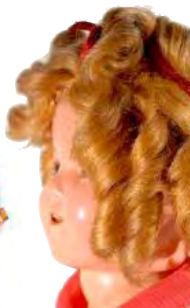
Muñeca de porcelana