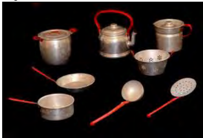
Juego de cocinita