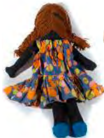
Muñeca de trapo